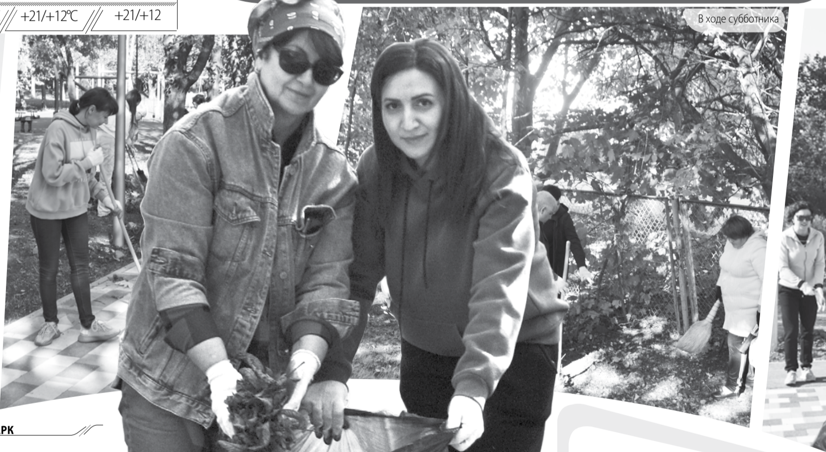
В ходе субботника