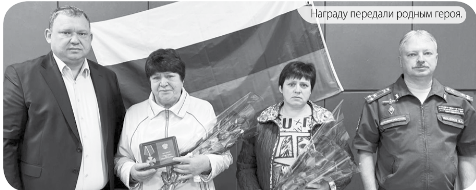
Награду передали родным героя.

8-928-350-80-70 ВИДЕОВОПРОСЫ (8652) 74-81-88 ТЕЛЕФОН ДОВЕРИЯ