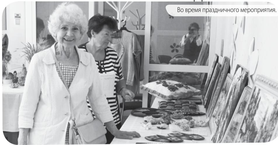
Во время праздничного мероприятия.

дения, родное Ставрополье!». Таланты проявили участники социальной практики активного долголетия - танцевальная студия «Благодать 60+» и «Ессентукские песняры». Они сами ведут творческую активную жизнь, и своим примером доказывают, что счастливым может быть каждый в любом возрасте,