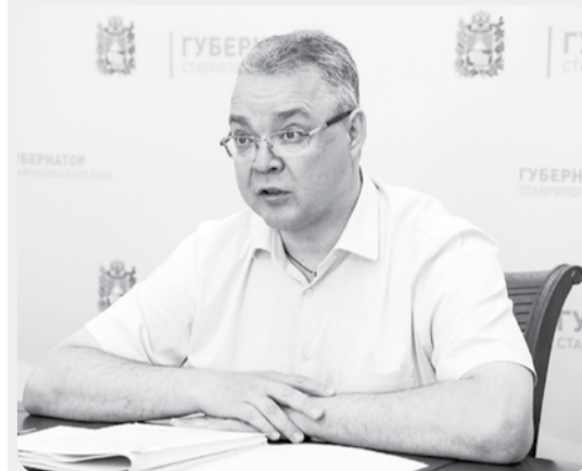
Владимир Владимирович: «Социальные объекты и многоквартирные дома готовы к отопительному сезону».

На сегодняшний день готовность края к холодам оценивается почти в 96%. Завершить комплекс работ необходимо к 15 ноября.